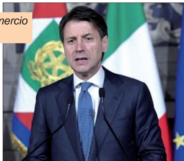
Il presidente del Consiglio Giuseppe Conte

“ F acciamo innanzitutto al presidente Conte e a tutto il Governo gli auguri di buon lavoro. Dopo una crisi politico-istituzionale che ha prodotto fibrillazione nei mercati e grande preoccupazione per imprese e famiglie, confidiamo che il nuovo Esecutivo lavori prioritariamente su due binari: consolidare il processo di riduzione del debito pubblico e di controllo del deficit per avere più margini di flessibilità in Europa e proseguire il percorso delle riforme economiche e sociali, iniziando dal blocco degli aumenti Iva che